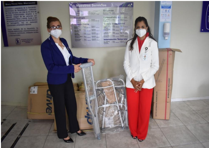
Entrega de útiles deportivos Club Plan Social del Billetero